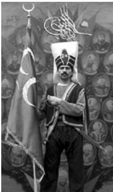
Lid van de Berlin Mehter Takimi met de Osmaanse oorlogsvlag.

'Wist u dat de mehter takimi het oudste militaire orkest van Europa is?', kopt de toenmalige website van deze Berlijnse militaire kapel. (1) Kenners van de Turkse cultuur noemen