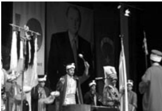
De Fatih Mehter Takimi in actie tijdens het 24e congres van de Turkse Federatie Europa (ADÜTDF) op 4 juni 2005. Op de achtergrond het portret van de huidige voorzitter van de Partij van de Nationalistische Actie (MHP), Devlet Bahçeli.

In 1826 schafte sultan Mahmud II (1785–1839) vanwege militair-politieke redenen het Janitsarenkorps (een infanterie-onderdeel van het leger) af en tegelijkertijd ook het militaire orkest. Inmiddels hadden andere Europese landen het nut van een militaire kapel ingezien en ontstonden er overal in Europa dergelijke orkesten.